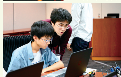
[下] 中高生が国際情報オリンピック向けの問題にチャレンジしたプログラミングのワークショップ