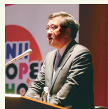
[上] 基調講演を行う東京大学 五神 真 総長