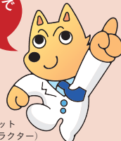
情報犬ビット (NII キャラクター)

http://www.nii.ac.jp/about/publication/today/